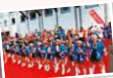
鶴見幼稚園の園児たちと、出演者全員で総踊り!