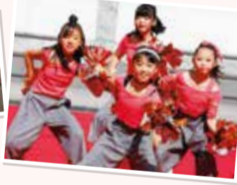
第2部の「区民カーニバル」では、区内で活動するバラエティ豊かなチームが登場。ダンス、ミュージカル、バンド演奏など、さまざまなパフォーマンスで盛り上がりました。