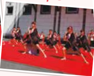
第1部は「大阪メチャハッピー祭」で全12チームが力強い踊りを披露しました。