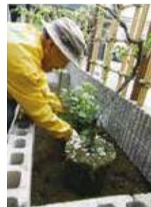
庭の手入れの様子