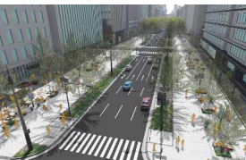
御堂筋の側道歩行者空間化イメージ▶