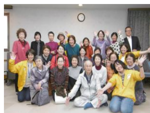
「あいまち」会員の皆さん