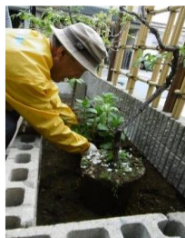
「あいまち」会員による活動風景