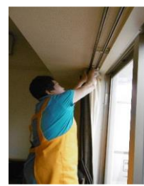
「あいまち」会員による活動風景