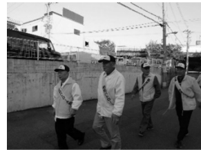
防犯の日一斉行動

問4 鶴見区では、地域・関係機関と連携した交通安全対策事業（子育て層、高齢者、幼児、児童、中・高校生など各対象別の交通安全教室などの交通マナーを高める取り組み）を行っています。