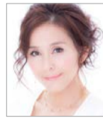
おおさかワンニャン特別大使 杉本彩さん

日 9/21(土)13:30～16:00 場 中央公会堂 問 健康局生活衛生課 ☎6208-9996 FAX6232-0364