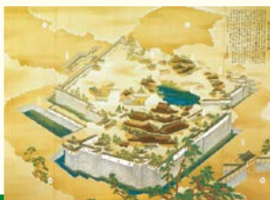
聚楽第図〈大阪城天守閣蔵〉