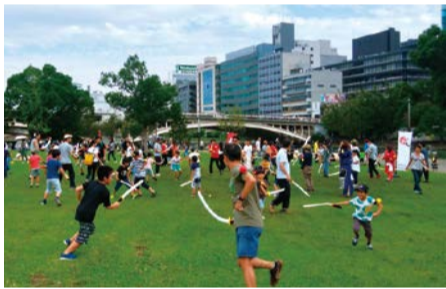
昨年の体験型アクティビティの様子

水辺の芝生で楽しく過ごす「クラフトピアピクニック」や体験型アクティビティといった親子で楽しめる外遊びなど、中之島公園を中心に水辺に親しむプログラムを多数展開。詳しくはHPをご覧ください。