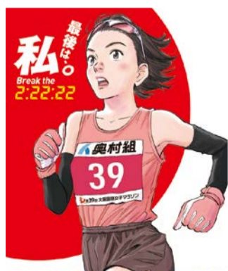
2020©浦沢直樹/N WOOD STUDIO

大阪国際女子マラソンはヤンマースタジアム長居を、大阪ハーフマラソンは大阪城公園・東側(玉造筋)をそれぞれスタートし、ヤンマースタジアム長居のフィニッシュをめざします。皆さんの熱い声援をお願いします。