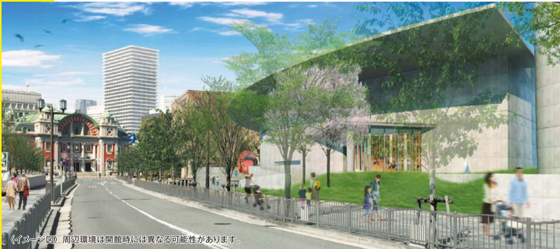
(イメージ図) 周辺環境は開館時には異なる可能性があります。