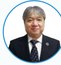
鶴見区長 長沢 伸幸

3月1日(日)つるみ日建ホール(鶴見区民センター大ホール)で「ステージ王国～手作り楽器でドンチャチャ～」を「鶴見活性化 楽園会議」の企画・運営により開催します。(1面・2面参照)