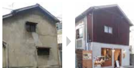
改修イメージ(改修前→改修後)

空家の利活用を予定されている方に、住宅の性能向上や、こども食堂・高齢者サロンといった地域まちづくりのための用途に改修する費用等の一部を補助します。補助内容など、詳しくはHPをご覧ください。