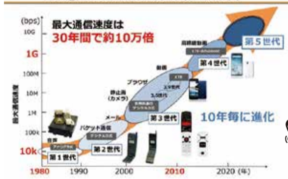
※「第5世代移動通信システムについて」(総務省平成30年10月)より