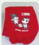
今回配布のカバー(赤)