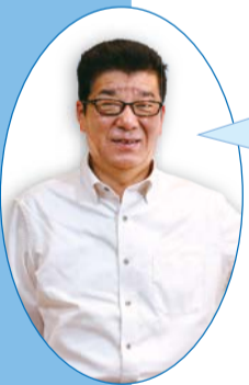
大阪市長 松井一郎

これからの行政は、地域の実情を見て、意見を聴き、施策を実行するニア・イズ・ベターがますます重要になります。