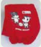
今回配布のカバー(赤)