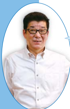
大阪市長 松井一郎

特別区制度では、大阪府と大阪市を再編し、広域機能は大阪府へ一元化し、大阪市をなくし基礎自治体として4つの特別区を設置します。