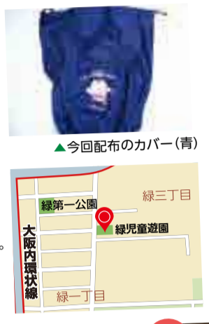
▲今回配布のカバー(青)