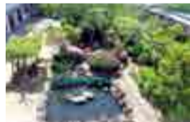
四季の移ろいが感じられる中庭