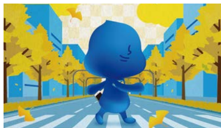
ウォークラリーイメージ

ウォーキングアプリ「スポーツタウン WALKER」を使用し、期間内に御堂筋周辺の全てのチェックポイントを回って完歩をめざすオンラインイベント。参加にはアプリのダウンロードが必要です。