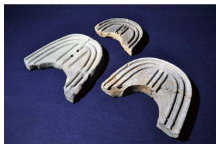
重圓文瓦 大阪市教育委員会蔵・大阪市文化財協会保管

発掘調査で見つかった遺跡・遺物と、日本最古の歌集『万葉集』に収められた大阪の歌を通して、飛鳥・奈良時代の難波を照らし出します。