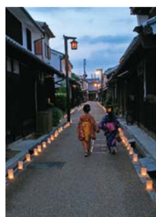
竹内街道・横大路の様子 H27年度フォトコンテスト入選作品「夕刻のひとこま」撮影場所:奈良県橿原市今井町

ウォーキングガイドツアーの動画配信やデジタルスタンプラリーなど、竹内街道・横大路の魅力を満喫できるプログラムをオンラインで開催します。