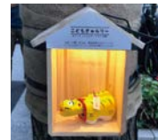
「こどもぎやらりー」のイメージ

☎ 11/3(水・祝)～12/31(金)17:00頃～23:00 ☎ 御堂筋(阪神前交差点～難波西口交差点) ☎ 経済戦略局観光課 ☎6469-5166 ☎6469-3896