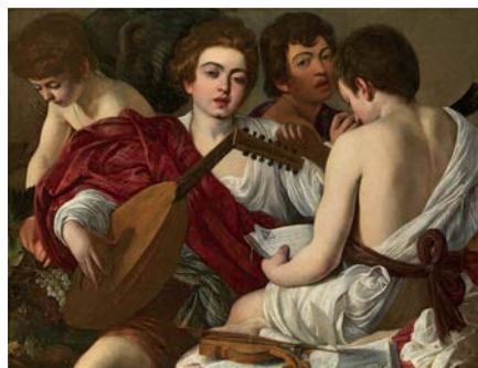
カラヴァッジョ(本名 ミケランジェロ・メリージ)《音楽家たち》1597年 ニューヨーク、メトロポリタン美術館 Rogers Fund, 1952 / 52.81

ラファエロ、カラヴァッジョ、レンブラント、フェルメール、モネ、ルノワール、ゴッホなどの珠玉の名作65点(うち46点は日本初