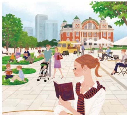
オープンカフェ・ピクニックイメージ

道路から公園に生まれかわった水都大阪のシンボル中之島公園で、青空の下、絵本を読むなど新たな憩いとにぎわいを楽しみませんか?申込方法など詳しくは☎をご覧ください。