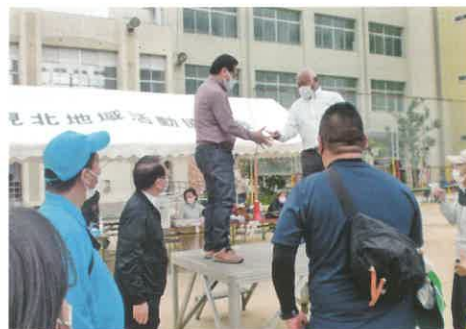
ジャンケン大会（内田区長 対 大東校長）