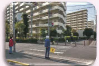
③ 6町会集会所前 信号