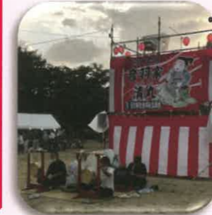
茨田南地区の有志 だんじり囃子

鶴見区内で最大級の敷地面積を誇り、特に盆踊りやお祭りの会場等、イベント面でも有名な公園です。直径約60mの円形グラウンドや、大きな複合遊具があります。また、木々に囲まれた約200mの遊歩道や、健康遊具が豊富に揃っています。※一部大阪府大阪市のデータを活用しています。