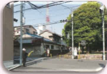
⑥ 茨田大宮西公園前 信号