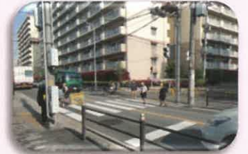
② 中央公園・第1住宅前 信号