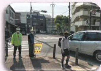
④ 福祉会館前 交差点