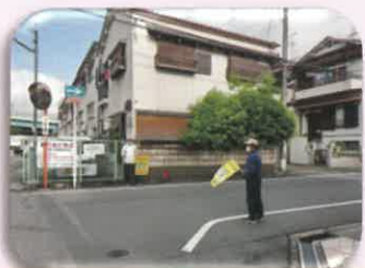
⑧ 15町会西側 横断歩道