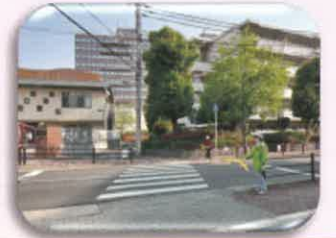
① 茨田大宮東子ども園前 横断歩道