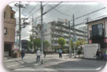
⑦ ほりぐちファミリー歯科前 交差点