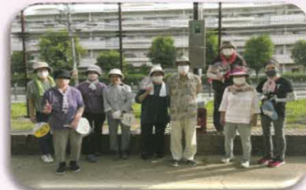
取材日：2022年4月16日(土) 7月30日(土)