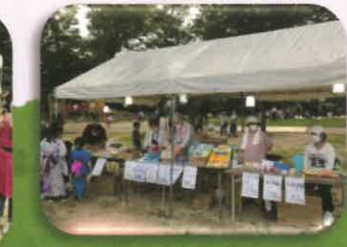
社会福祉活動 推進事業委員会