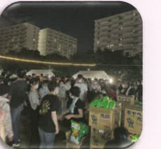
連合子ども会のお菓子プレゼント

本年度は音頭取りの方をお招きし、踊り手さんの演舞も盛り上がりました。各団体は模擬店を行い、小学生以下のお子さんにはお菓子のプレゼントタイムを設け、活気ある声と笑顔が飛び交い、大人も子供も、盆踊りを楽しみました。