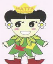
まったりみどりちゃん