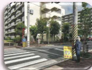
⑤ 第3住宅6・7棟 横断歩道