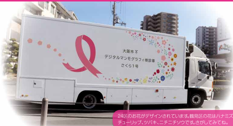
24区のお花がデザインされています。鶴見区の花はハナミズキ、チューリップ、ツバキ、ニチニチソウです。さがしてみてね。