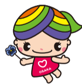
大阪市人権啓発マスコットキャラクター「にっこりな」

地域には病気や障がい、介護、子育てなど配慮や支援などが必要な方がいます。過剰な詮索や本人の承諾を得ずに第三者に情報を伝えることは人権侵害につながります。年度交替りを迎え地域の顔ぶれが替わるなか、一人ひとりが地域で快適に暮らせるよう、お互いのプライバシーを尊重しましょう。人権啓発・相談センターでは、専門相談員が人権に関するさまざまな相談をお受けしています(無料・秘密厳守)。☎6532-7830(なやみゼロ)・FAX6531-0666・📧で相談ください。 📄 市民局人権企画課 ☎6208-7611 FAX6202-7073