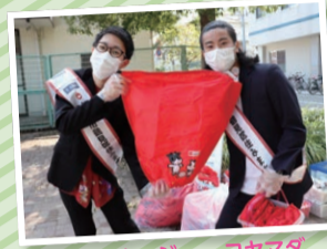
かとうススムー ジー コヤマダ