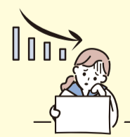
成績に影響が出たり...

A. 年齢に見合わない重い責任や負担を負うことで、自分の時間や勉強する時間、友人と遊ぶ時間が取れない、ケアについて話せる人がいなくて孤独やストレスを感じる、睡眠が十分に取れない、などの影響が出る可能性があります。