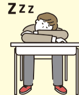
授業に集中できなくなったり...