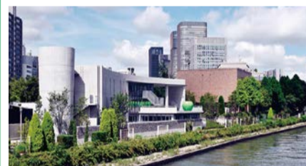
第40回大阪市長賞:こども本の森 中之島

周辺景観の向上に資し、かつ景観上優れた建物やまちなみを推薦していただき、特に優れたものを表彰します。