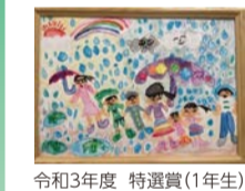
令和3年度 特選賞(1年生)