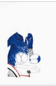
令和3年度 障がい者週間のポスター 小学生部門 最優秀賞作品

障がいのある人とない人との心のふれあいをテーマにした作文またはポスターを募集。対象は市内在住・在学の①小学生以上②小・中学生。申込方法など詳しくはHPをご覧ください。