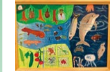
令和3年度 特選賞(4年生)