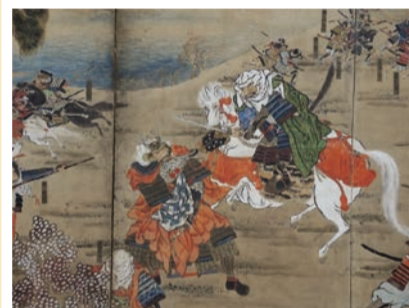
川中島合戦図屏風(大阪城天守閣蔵)

絵画や文字資料などさまざまな形を取り、虚実織り交ぜたストーリーとして現代にまで伝えられた戦国時代の名高い合戦や歴史的な重大事件に迫ります。