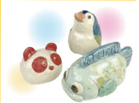
陶器の貯金箱作品イメージ

吹きガラス・陶芸・染色・織物・木工・金工など10種類の本格的な工芸体験ができる体験教室。定員4～30人(先着順)。各教室の対象年齢や費用など、詳しくはHPをご覧ください。