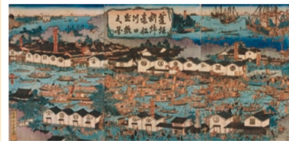
菱垣新綿番船川口出帆の図(大阪城天守閣蔵)

徳川幕府のもとで息を吹き返して経済の中心地となり、幕末政治の舞台ともなった大坂の歩みをたどります。