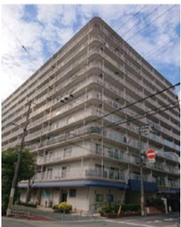
第35回ハウジングデザイン賞特別賞受賞住宅

魅力ある良質な集合住宅を表彰する「大阪市ハウジングデザイン賞」を実施。推薦いただいた方の中から抽選で50人に図書カード(500円分)をプレゼント。