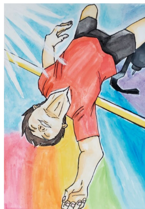
令和4年度 障がい者週間のポスター 小学生部門 最優秀賞作品