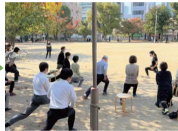
お昼休み☆20分ゆるゆるストレッチ