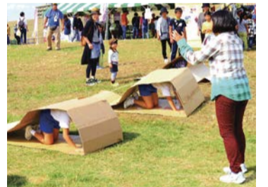
ダンボールキャタピラ

問い合わせ▶建設局調整課 ☎06-6615-6704 FAX06-6615-6070