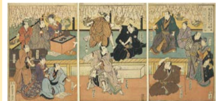
浪花道頓堀大歌舞伎舞台惣構古之図(南木コレクション)(大阪城天守閣蔵)