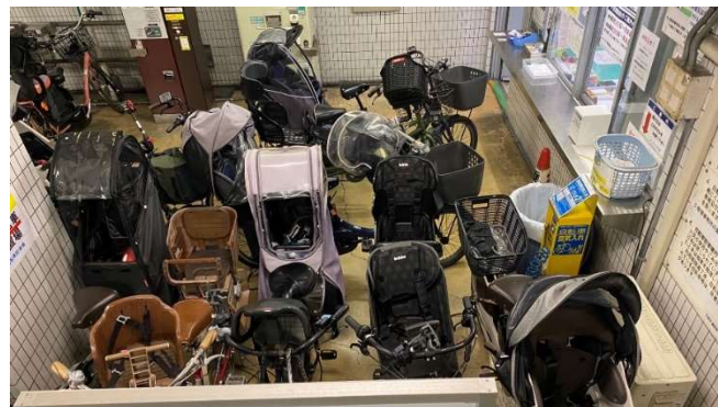
参考：駐輪スペースが少ないため、通路まで溢れる大型自転車

鶴見区役所、鶴見区民センター及び鶴見区老人福祉センター前駐輪場は、施設利用者が無償で利用できる。また、近隣に Osaka Metro 横堤駅があり、建設局によって横堤駅自転車駐車場（以下、「横堤駐輪場」という）が有料で運営されているが、以下の課題がある。