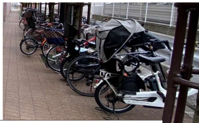
参考：常態化する不正駐輪