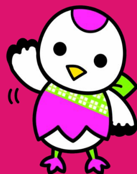
鶴見区マスコット キャラクター 「つるりっぶ」