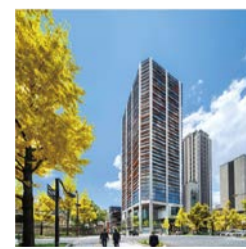
第44回 大阪市長賞: 御堂筋ダイヤビル

周辺環境の向上に資し、かつ景観上優れた建物やまちなみを推薦してください。特に優れたものを表彰します。