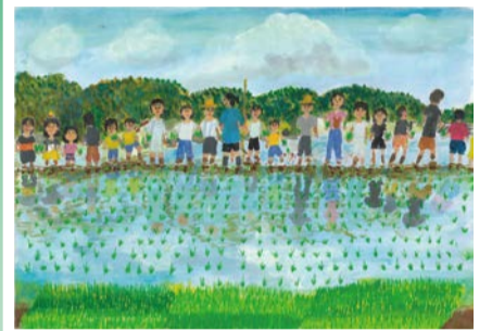
令和7年度 特選(3年生)