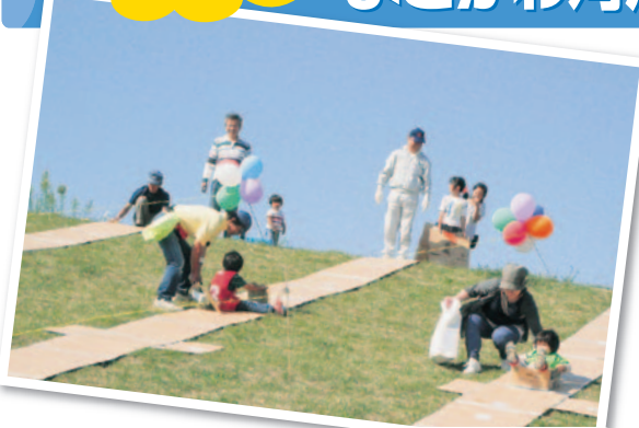
ダンボールDEころころ

自然の宝庫「淀川」を舞台に、13年目! ひろ〜いよどがわ河川敷で、盛りだくさんの内容!! みんなで楽しいひと時を過ごしましょう♪