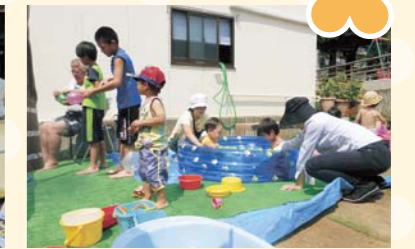
木川南地域(ゆめキッズ16号より)