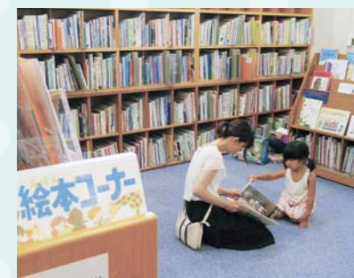
絵本コーナーでお母さんの読み聞かせ♪

図書館は、皆さんの子育ての悩み・疑問を、たくさん本や資料で解決・サポートします。親子で絵本を楽しんだり、育児情報をGETしたり、図書館をどんどん活用してください。分からない事は気軽に聞いてください。利用はもちろん無料です。