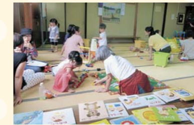
野中地域(ゆめキッズ17号より)