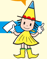
大阪市長選挙 マスコット 「センキョン」