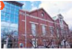
▲ゴールの造幣博物館では施設の見学もできます。

桜の咲く時期に、淀川河川 参加費無料 敷をみんなで歩きませんか。 日時 4月4日(火) 8:45集合(小雨決行) 集合場所 区役所玄関前 行程 約9km(9:15区役所出発→淀川河川敷 →造幣博物館→12:30頃現地解散) ▲ゴールの造幣博物館では施設の見学もできます。 定員 40名 申込方法 3月13日(月)から24日(金)まで電話にて(先着順)。 問合せ 保健福祉課(健康づくり)2階22番 電話6308-9882