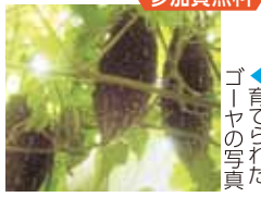
▲育てられたゴーヤの写真

ご自宅や会社で緑のカーテンづくりに挑戦してみませんか? 参加者には、ゴーヤの種をお配りします。 日時 4月28日(金) 14:00～16:00 場所 区役所501・502会議室 対象 区内在住・在勤の方 定員 50人(申込多数抽選) 申込 [氏名(ふりがな)・住所・電話番号・緑のカーテン講習会希望]と記入して、往復ハガキで。お2人で参加の場合は、2人と明記してください。4月18日(火)必着。 あて先 〒532-8501 淀川区十三東2-3-3 問合せ 市民協働課4階41番 電話6308-9409