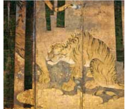
竹虎図屏風(部分) 桃山時代の狩野派の作品

天下統一の変革期に花開いた、豪華絢爛でエネルギー溢る桃山文化の世界を知っていただくため、大阪城天守閣が収蔵する桃山美術の優品を選んで展示。費用600円ほか。☎3/18(土)~5/7(日) 9:00~17:00 (3/25(土)~4/9(日)は19:00まで) ※入館は閉館の30分前まで ☎場間大阪城天守閣 ☎6941-3044 FAX6941-2197