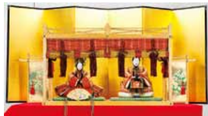
享保雛(住まいのミュージアム所蔵)

浪花の豪商「加島屋」(廣岡家)伝来の雛人形や雛道具を初めて展示。豪商の雛道具にみる大坂の華やかな文化を楽しめます。費用300円(企画展のみ)ほか。☎4/2(日)まで10:00~17:00(入館は16:30まで)、火曜と3/22(水)は休