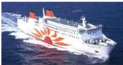
②使用予定船舶「さんふらわあ こぼると」

大阪港に就航する大型フェリーで、明石海峡大橋を眺めながら大阪湾をめぐるクルーズ。今年は大阪港開港150年を記念して特別に2隻で実施します。船は選べません。定員1500人(2隻計)。小学生以下は保護者同伴。 日 7/23(日)①11:00~14:30②11:30~