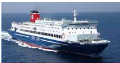
①使用予定船舶「フェリーおおさかII」