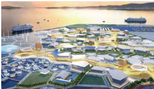
夢洲から南西を望む夕景の会場鳥瞰図。淡路島、明石海峡大橋を背景に、美しい景観が広がります。(会場面積:155ha)

問い合わせ 経済戦略局万博誘致推進室 ☎6615-3036 FAX6615-7433