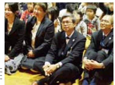
▶新高小学校のSPS認証式にて。児童の皆さんと一緒に集合写真をパシャリ。