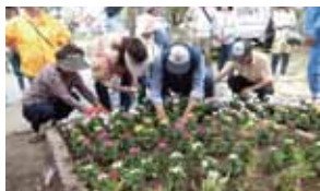
人気の花壇実習の様子

花づくりの基礎知識から実習まで体系だてて、学びませんか?花に関心をお持ちの方々のご参加をお待ちしています。