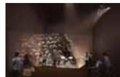
豊臣石垣公開イメージ