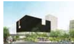
新しい美術館の完成イメージ(基本設計より)