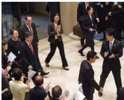
大阪役所での歓迎の様子