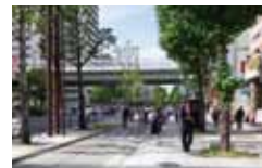
御堂筋の側道歩行者空間化(難波～難波西口交差点)