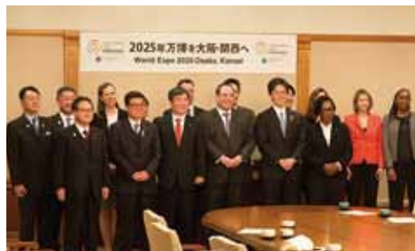
吉村市長・松井府知事を表敬