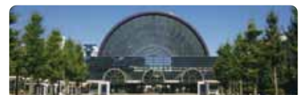
会場予定地: インテックス大阪(大阪国際見本市会場)

日本初開催の「G20サミット首脳会議」開催地が大阪に決定。2019年に約35か国・機関が大阪に集います。 問 経済戦略局国際担当 ☎6615-3757 FAX 6615-7433