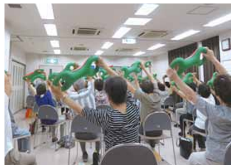
7月から「やすらぎげんき倶楽部」を開催予定です!! 詳細についてはお問合せください。