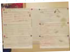
睡眠の質を向上させる方法を 発表したヨドネル担当