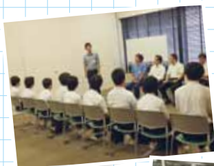
辞令を頂き、ドキドキの 職業体験スタート!