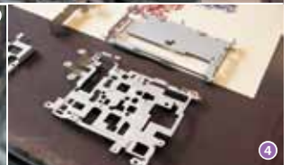
① 様々な新製品を生み出すエイトテックの皆さん。② 数々の大きな機械を巧みに操る。③ 絶妙な力加減が製品の出来を左右する。④ 繊細な加工が施された精密板金。