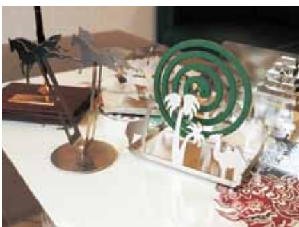
▲社長のアイデアから生まれた多彩なオリジナル製品。

お客様のニーズに応じて、どんどん新製品を開発したいと熱意あふれる株式会社エイトテック。これからも淀川区から世界にただ一つのオリジナル製品が誕生していく。