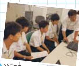
SNSを使った情報発信に挑戦!