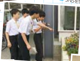
カメラを持って取材へ! スクープ発見!?