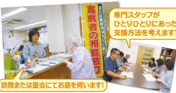
訪問または面会にてお話を伺います!

「最近、身体が弱ってきて今後のことが心配」、「高齢の家族と同居、この頃、物忘れが目立つけど心配だわ…」など、高齢者や家族のお困りごとを社会福祉士やケアマネージャー、保健師等の専門スタッフが一緒に解決します。また、介護予防にも取り組んでいますので、まずはお気軽にご相談ください!