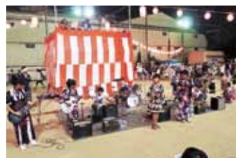
▲田川地域の盆踊り大会では子ども会によるバンドが登場!!

特に若い世代の皆さん、地域の安全・安心を守るためには皆さんの力が必要です。まずは、おまつりなどに「あれ?何か面白そうやな。子どもを連れて行ってみよかな?」くらいでかまいません。こうした地域行事に積極的に参加していただいて、少しずつ地域のごことが好きになってもらえらな、と願っています。