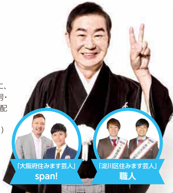
「大阪府住みます芸人」 span!

問合先 総務課 ☎6308-9625 中村・浦出 ※抽選結果は応募者全員に返送いたします。