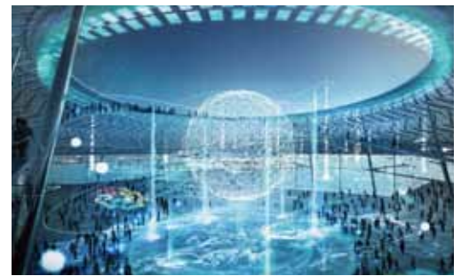
2025年国際博覧会 イメージ図