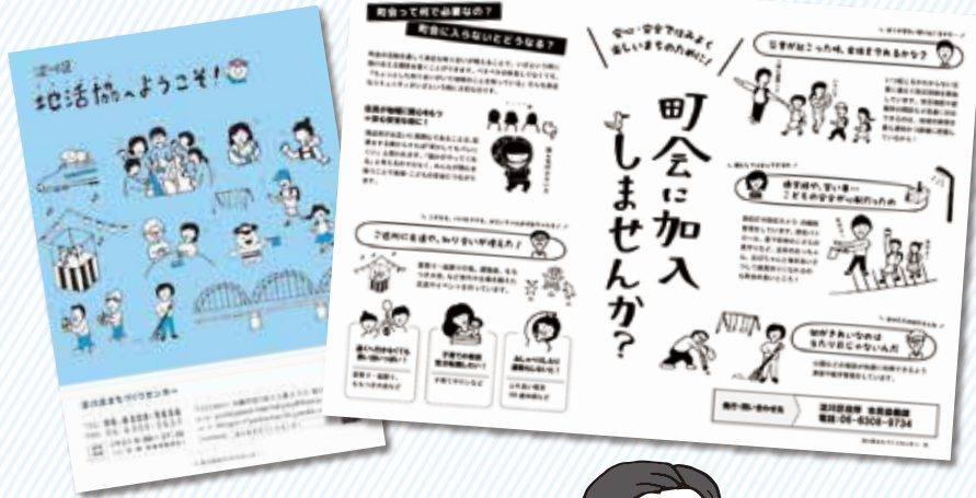
▲区役所で地活協や町会についてご紹介するパンフレット配布中!

まだ町会に加入されていない方も、町会に加入して「いざという時に助け合える関係」づくりをしませんか?