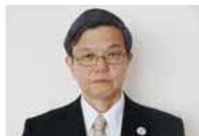
▲新年度、気持ちを引き締めて...

私は昔「何で小学生の僕でも漢字書けるのに、お父ちゃんは書かれへんねんやろう?」と内心父を馬鹿にしていました。今なら、漢字の読み書きも出来ないのに頑張って自分達を養ってしてくれてるんじゃないかと、もしタイムマシンがあるならその時の自分を殴りつけたい。父も母と同じく何の恩返しもできぬまま早くに亡くしてしまいました。本当に親不孝息子です。その分、淀川区の皆さんに恩返ししますね。