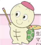
生涯学習ルーム マスコットキャラクター 「スタートル」