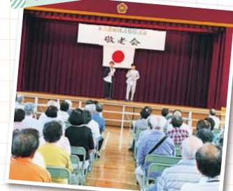
▲「笑い」から長生きのお手伝いをさせていただきました!

▼新イベント「コスプレパフォーマンス」の司会進行をしました!ステージ上は大騒ぎ!