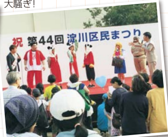
「第44回淀川区民まつり」

▼新イベント「コスプレパフォーマンス」の司会進行をしました!ステージ上は大騒ぎ!