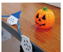
▲手作りの飾りで季節感も大切に!

今月は取材で塚本地域のふれあい喫茶にお邪魔しました。コーヒーのいい香りあふれ、参加者の方々が楽しく談笑している空間はとても居心地のいいものでした。ふれあい喫茶で、温かいコーヒーや紅茶を味わいながら、地域のみなさんと楽しいひとときを過ごしてみませんか?(広報担当:岡田)