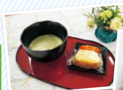
▲お抹茶でほっこり