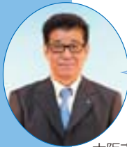
大阪市長 松井一郎